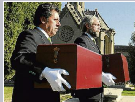
► Les dues urnes amb les restes mortals van presidir a l'entrada del panteó Cuitó-Amat la cerimònia d'ahir al matí.