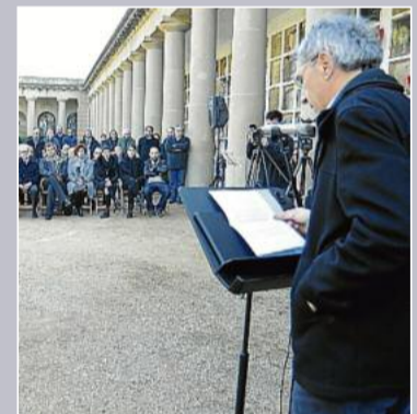
► El president de l'Associació Memòria i Història de Manresa es va adreçar en primera persona a l'Amat i va parlar en nom de la família de l'escriptor.