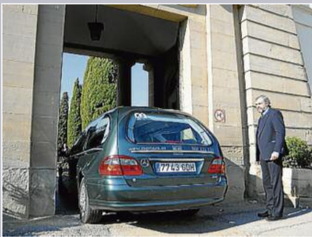
► Entrada al cementiri de Manresa del cotxe fúnebre de Mémora amb les urnes amb les despulles d'Amat-Piniella i Fernández.